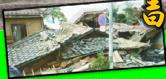
○阪神淡路大震災で倒壊した長濱家